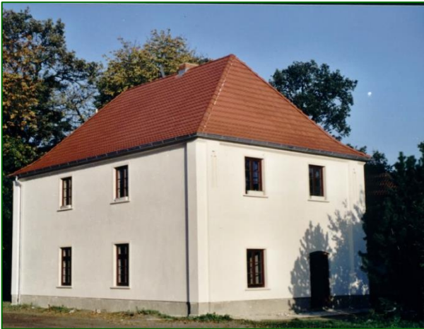
Gärtnerhaus der damaligen Gutsherrschaft, gebaut um 1900, heute Ausstellungsbereich und Ferienwohnungen

Je nach Bedarf stehen Apartments, Einzel- oder Doppelzimmer zur Verfügung, die mit oder ohne Frühstück gebucht werden können. Um Anreise bis 16 bzw. 17 Uhr wird gebeten.